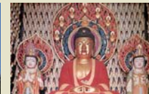
阿弥陀三尊と一万体観音